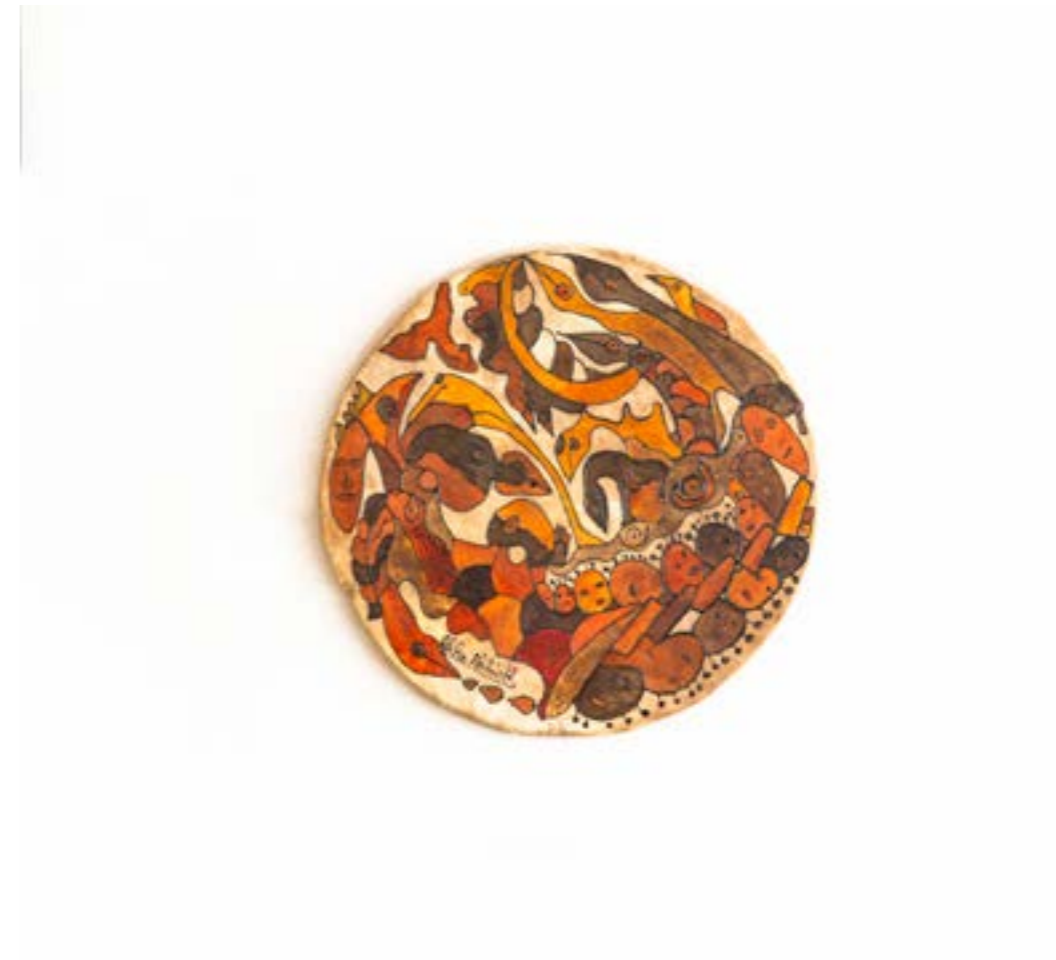
Sans titre, 2017 Acrylique sur peau de mouton, ø : 37 cm