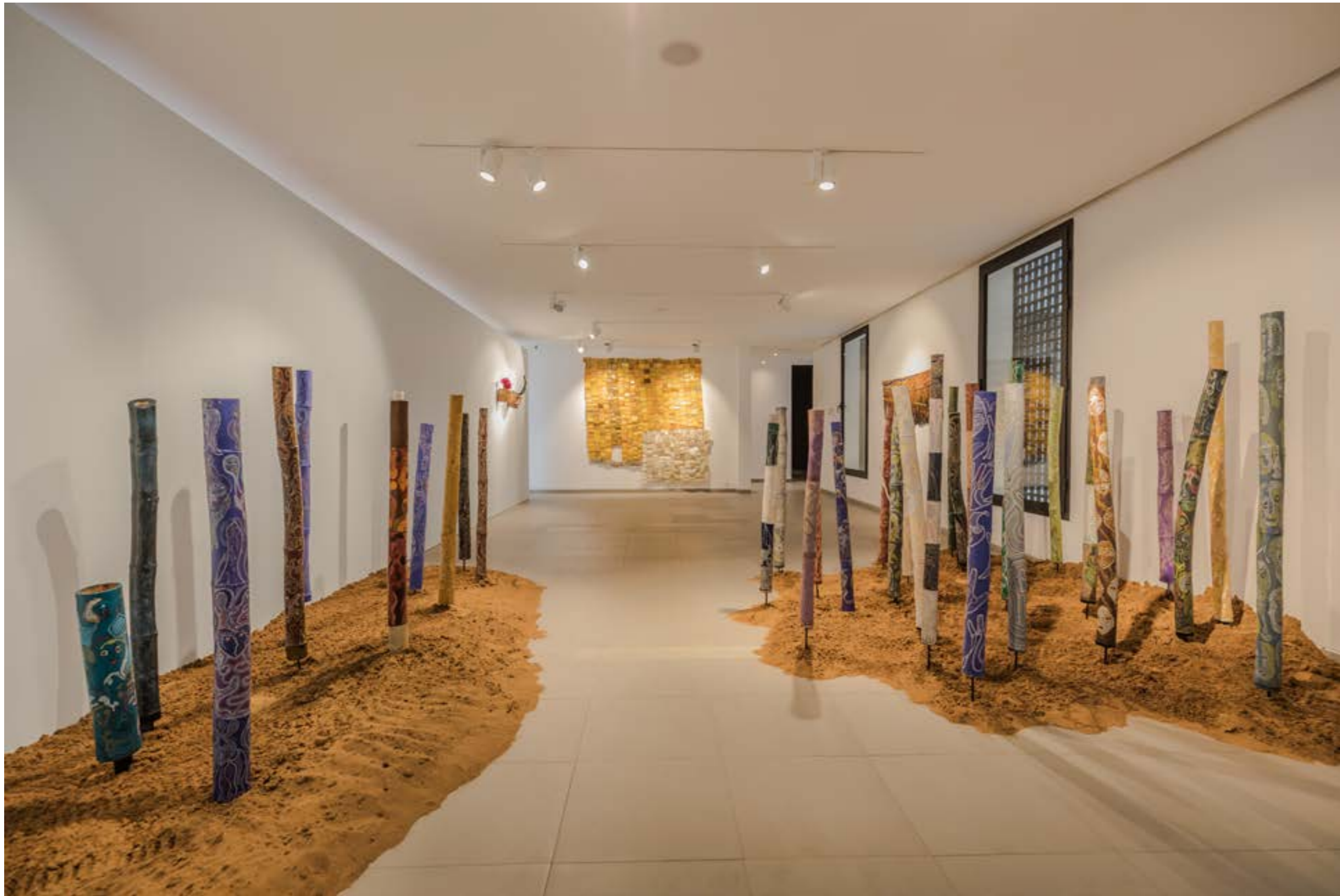
Bamboo Forest , 2017 Installation, acrylique sur bambous, dimensions variables Vue de l'exposition Second Life Second Breathe , MACAAL 2018