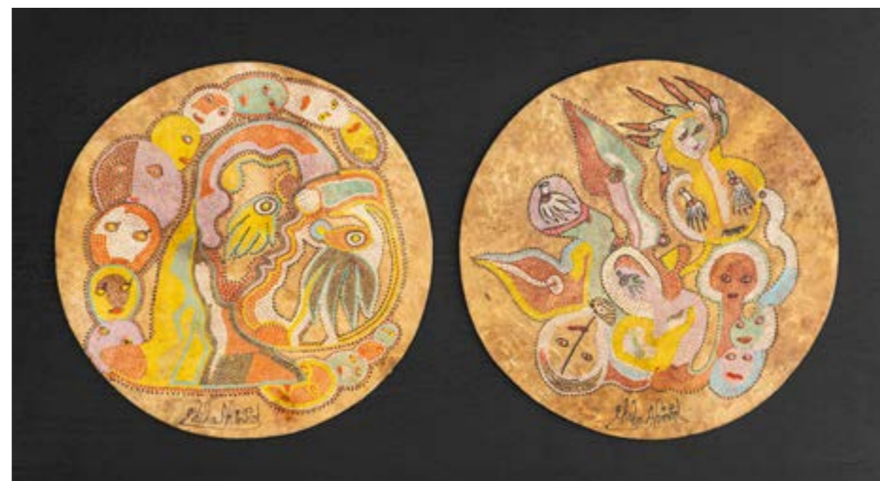
Couleurs de la transe , 2017 Acrylique sur peau de mouton, 2 x ø : 45 cm