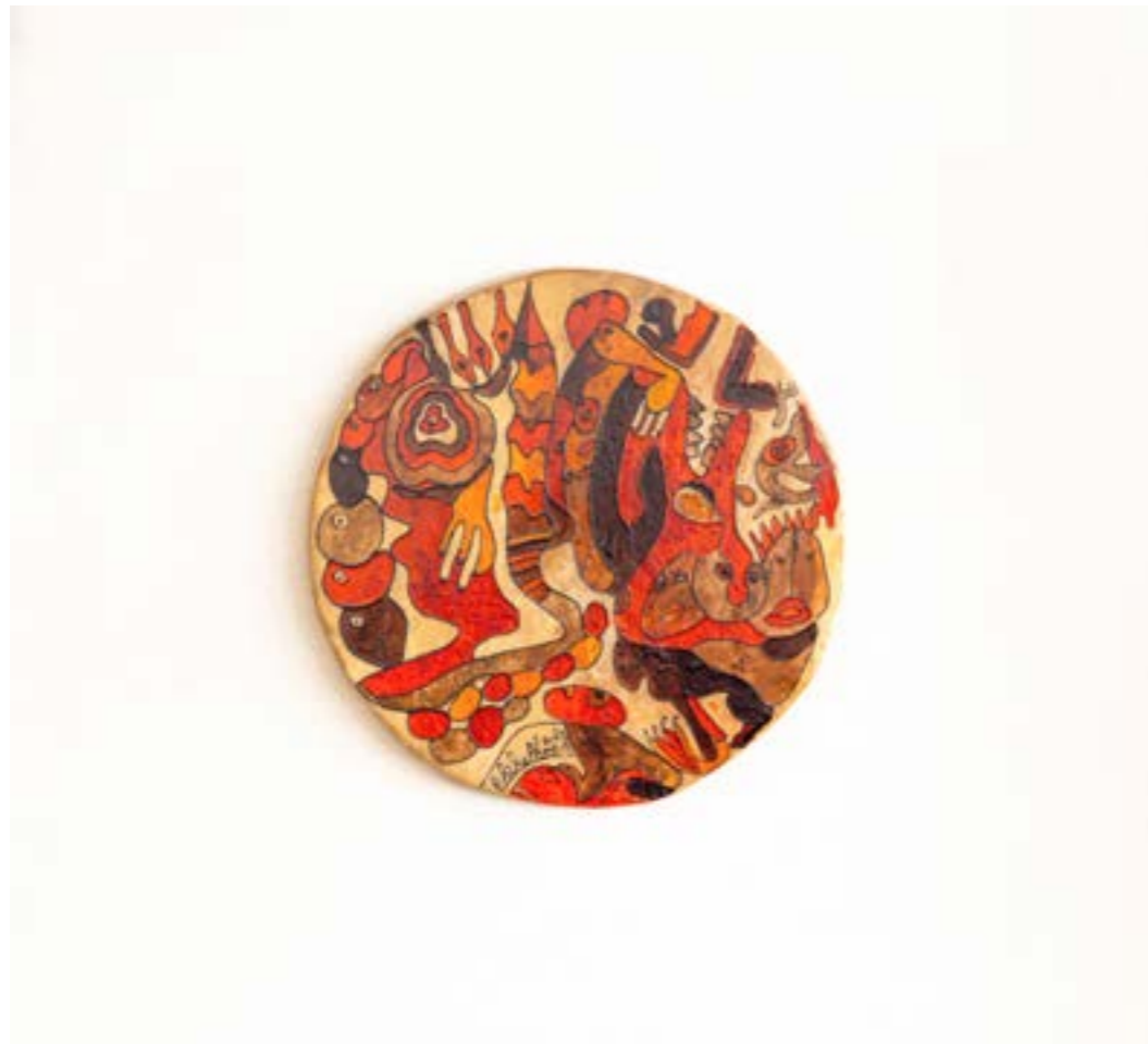
Sans titre, 2017 Acrylique sur peau de mouton, ø : 37 cm