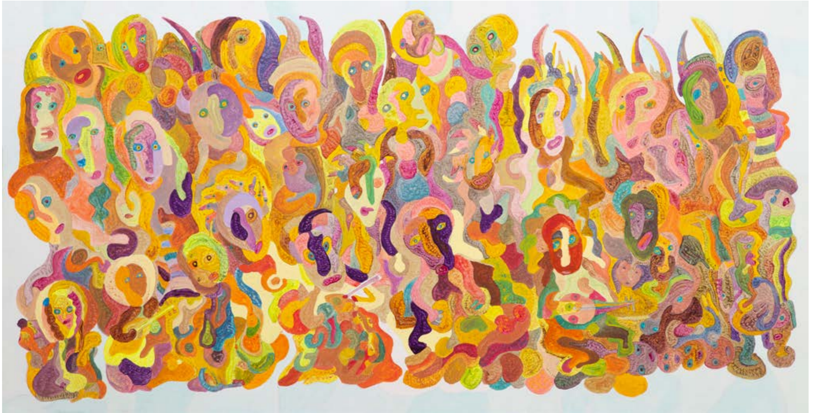
Silhouettes I , 2017 Technique mixte sur toile, 106x210 cm