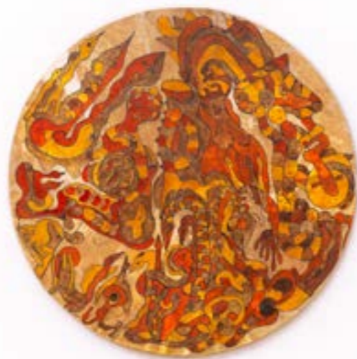
Apparition I , 2017 Acrylique sur peau de mouton, ø : 70 cm