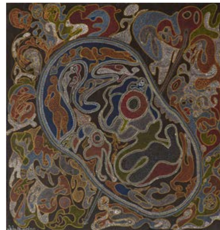
Sans titre, 2014 Technique mixte sur toile, 100x95 cm