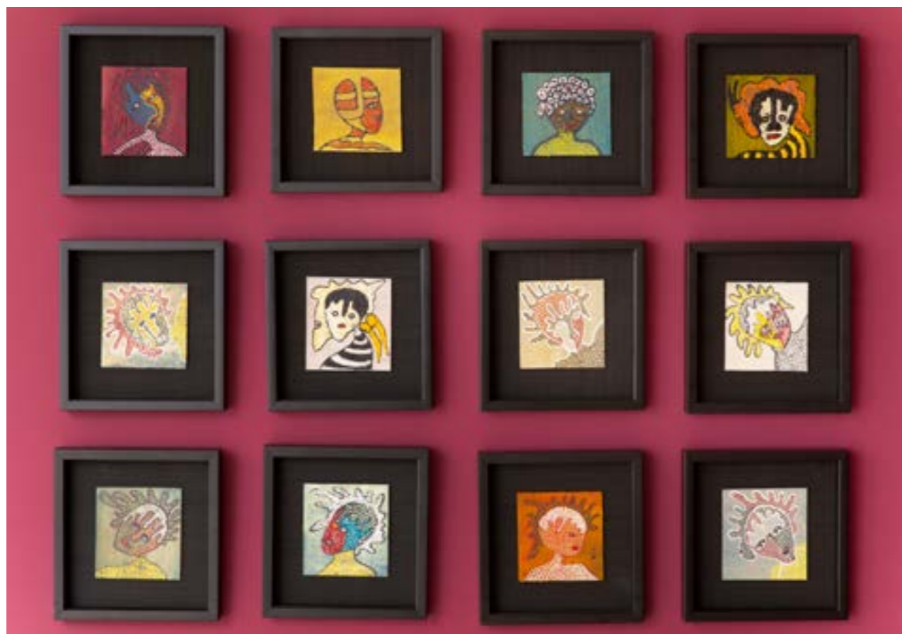
Série Régénération I , 2017 Acrylique sur toile, 15x15 cm