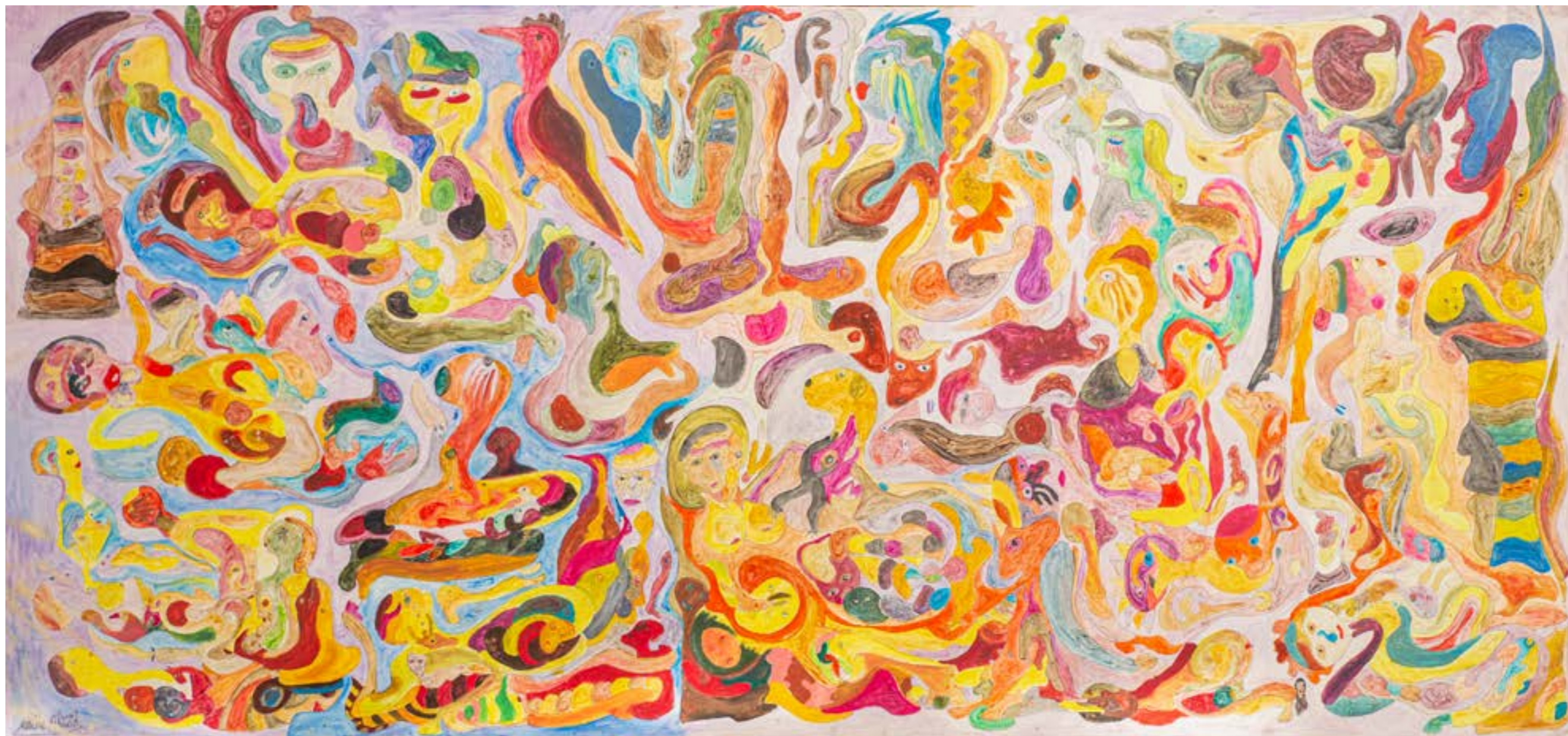
Silhouettes II , 2017 Technique mixte sur toile, 95x202 cm