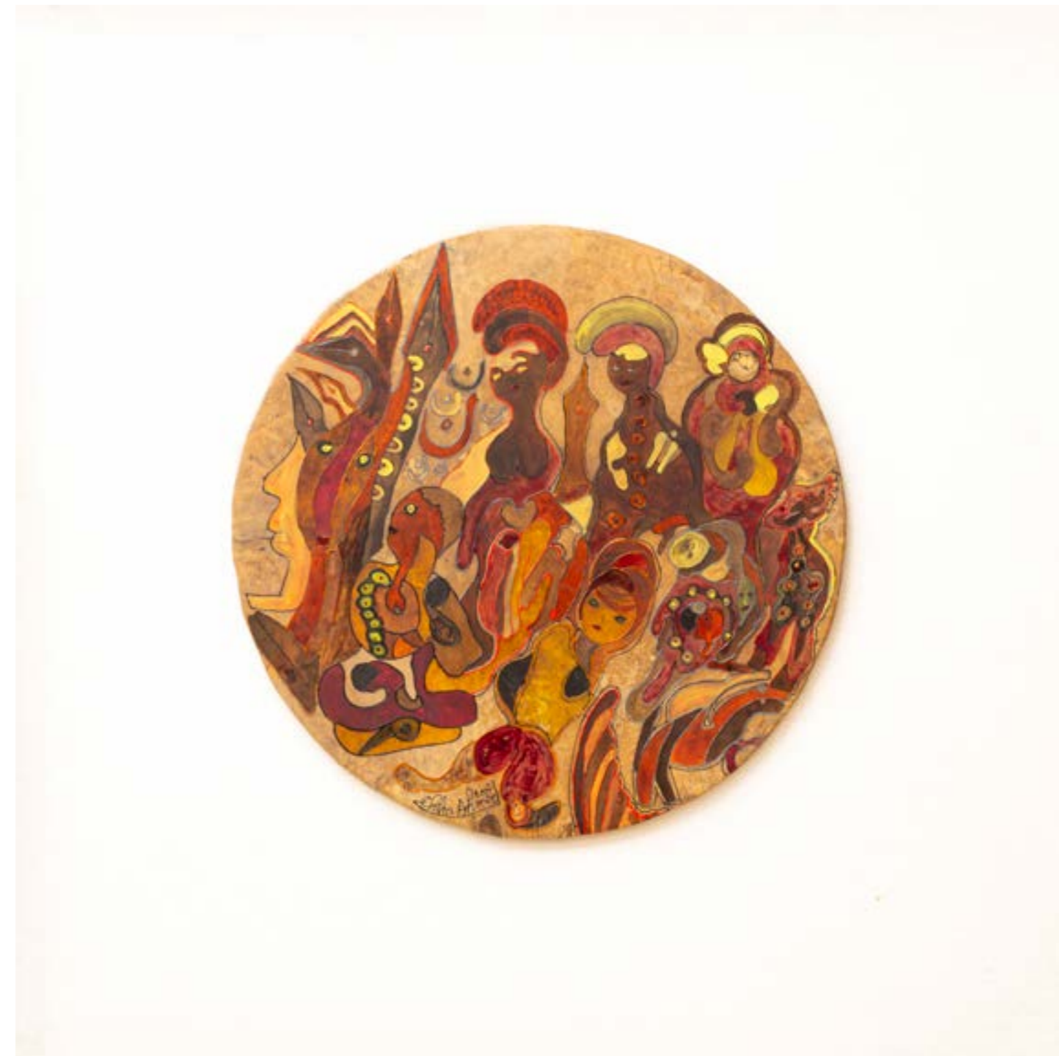
Apparition III , 2017 Acrylique sur peau de mouton, ø : 70 cm