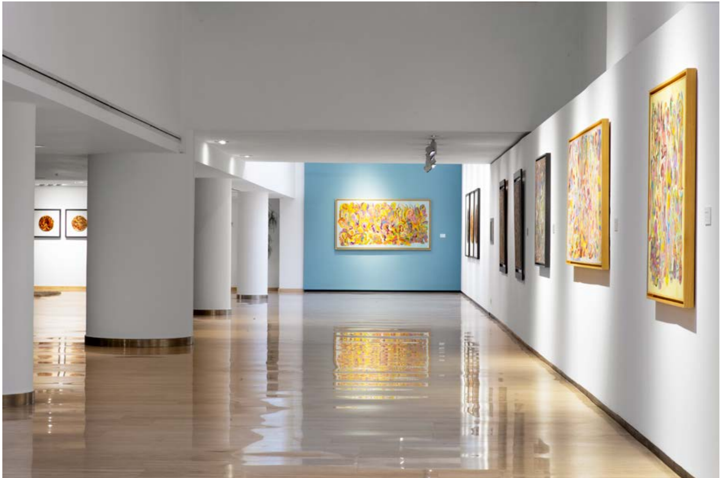
Espace culturel Fondation Alliances Vue de l'exposition d'Ahmed Chiha, L'empreinte de mes rêves