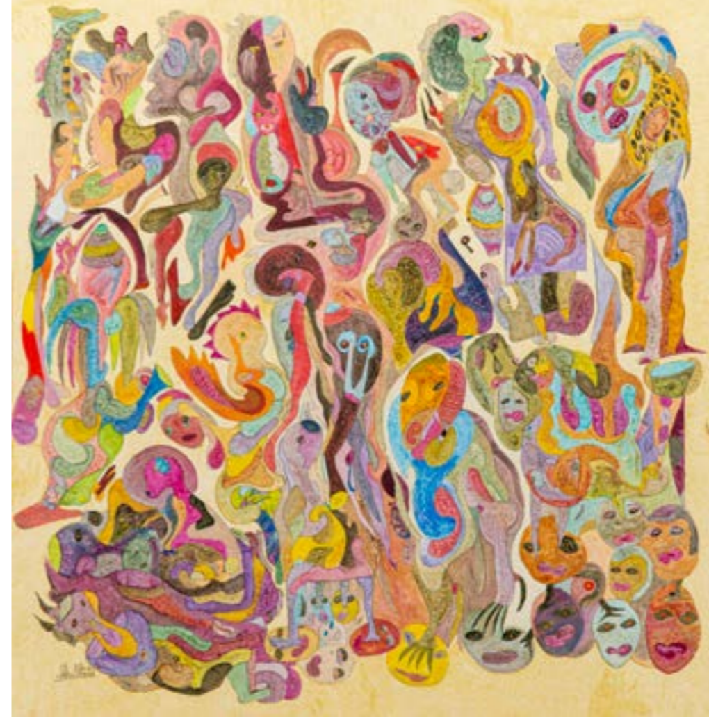
Composition sable, 2017 Technique mixte sur toile, 105x108 cm