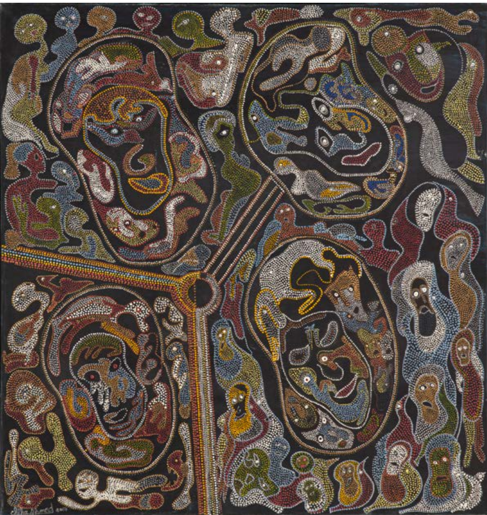
Après la danse, 2014 Technique mixte sur toile, 100x95 cm