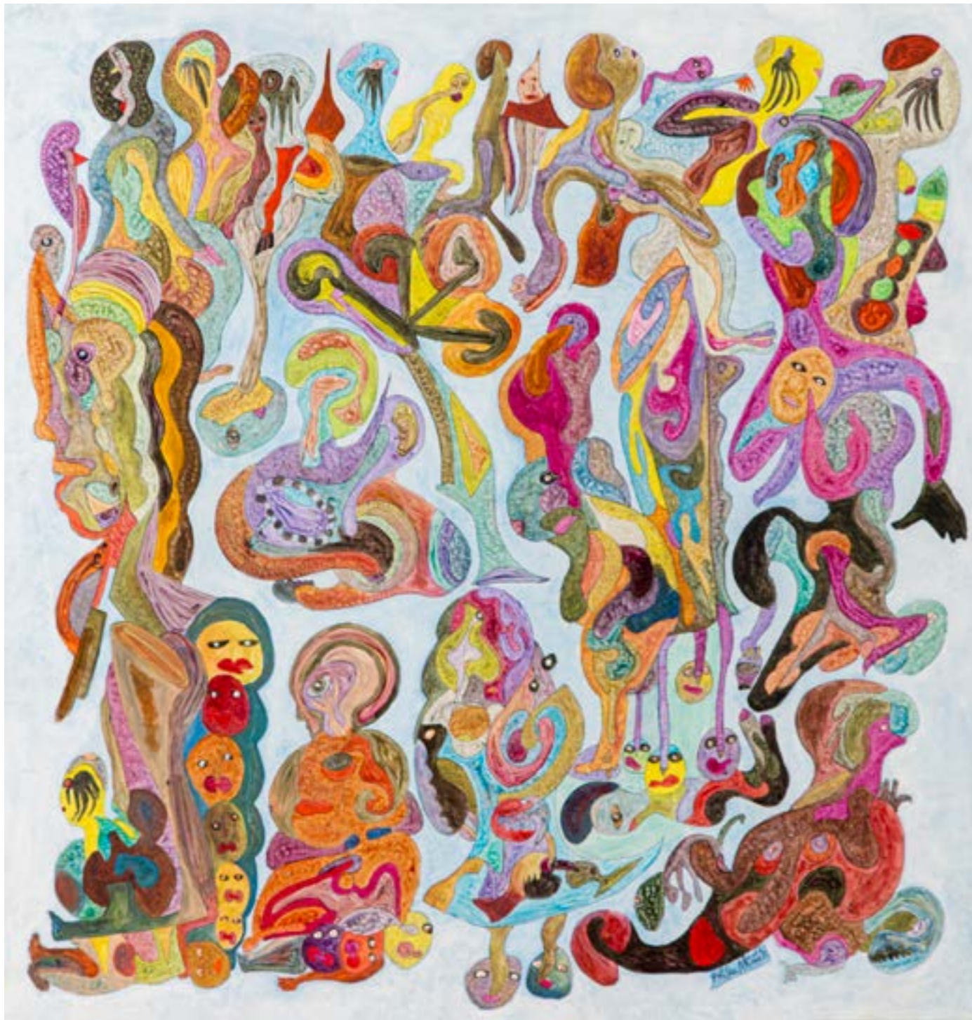
Composition bleue, 2017 Technique mixte sur toile, 115x115 cm