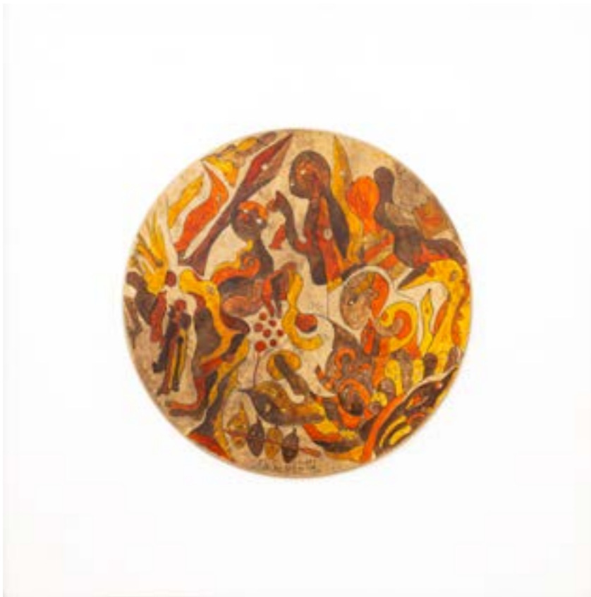
Apparition II , 2017 Acrylique sur peau de mouton, ø : 70 cm