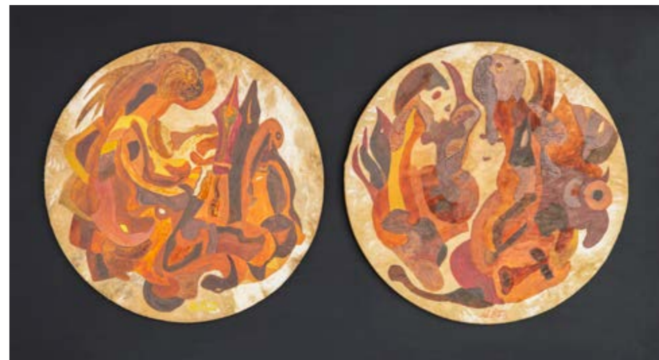
Naissance d'une forme, 2017 Acrylique sur peau de mouton, 2 x ø : 45 cm