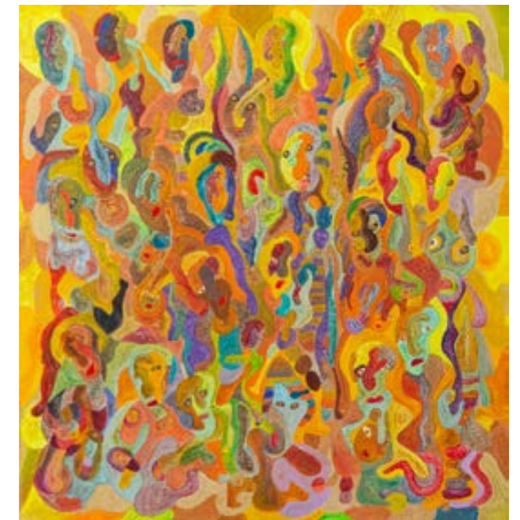
Composition jaune, 2017 Technique mixte sur toile, 108x103 cm