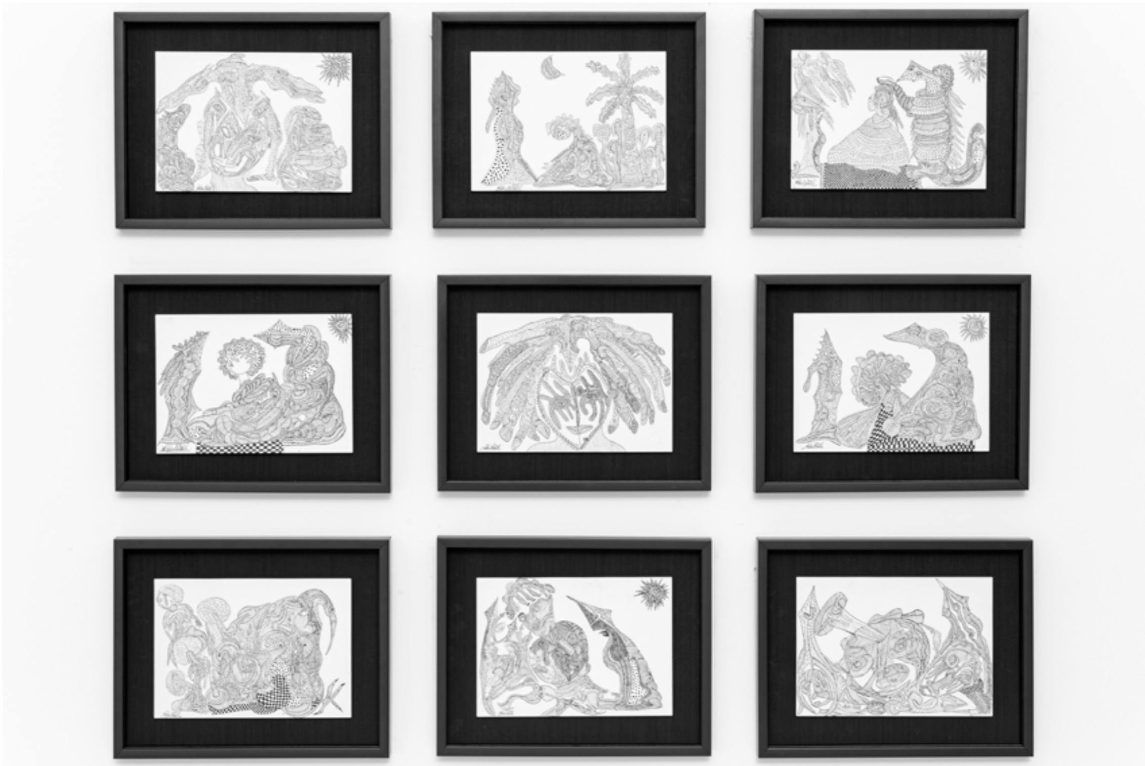
Série Naissance du rêve , 2020 Encre sur papier, 30x20 cm